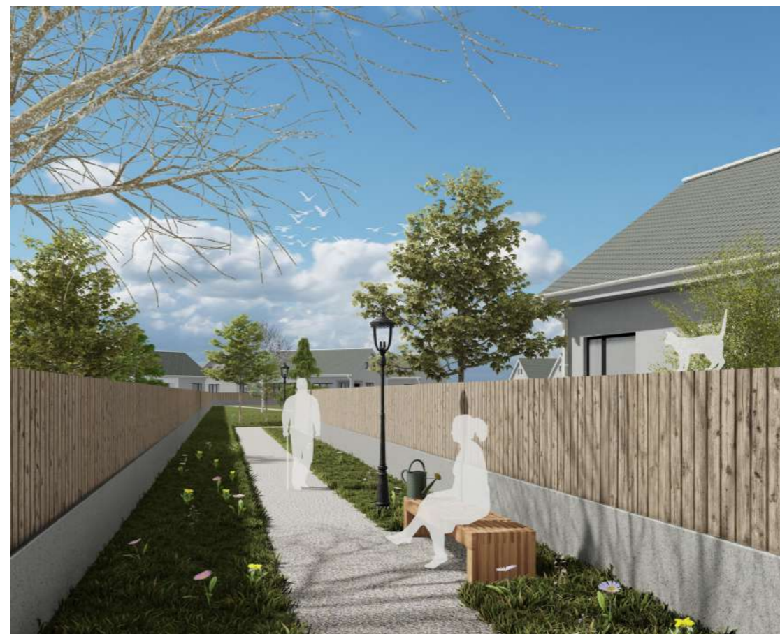
Perspectiva din aleea de acces a spatiului verde central (UTR Va/s*)