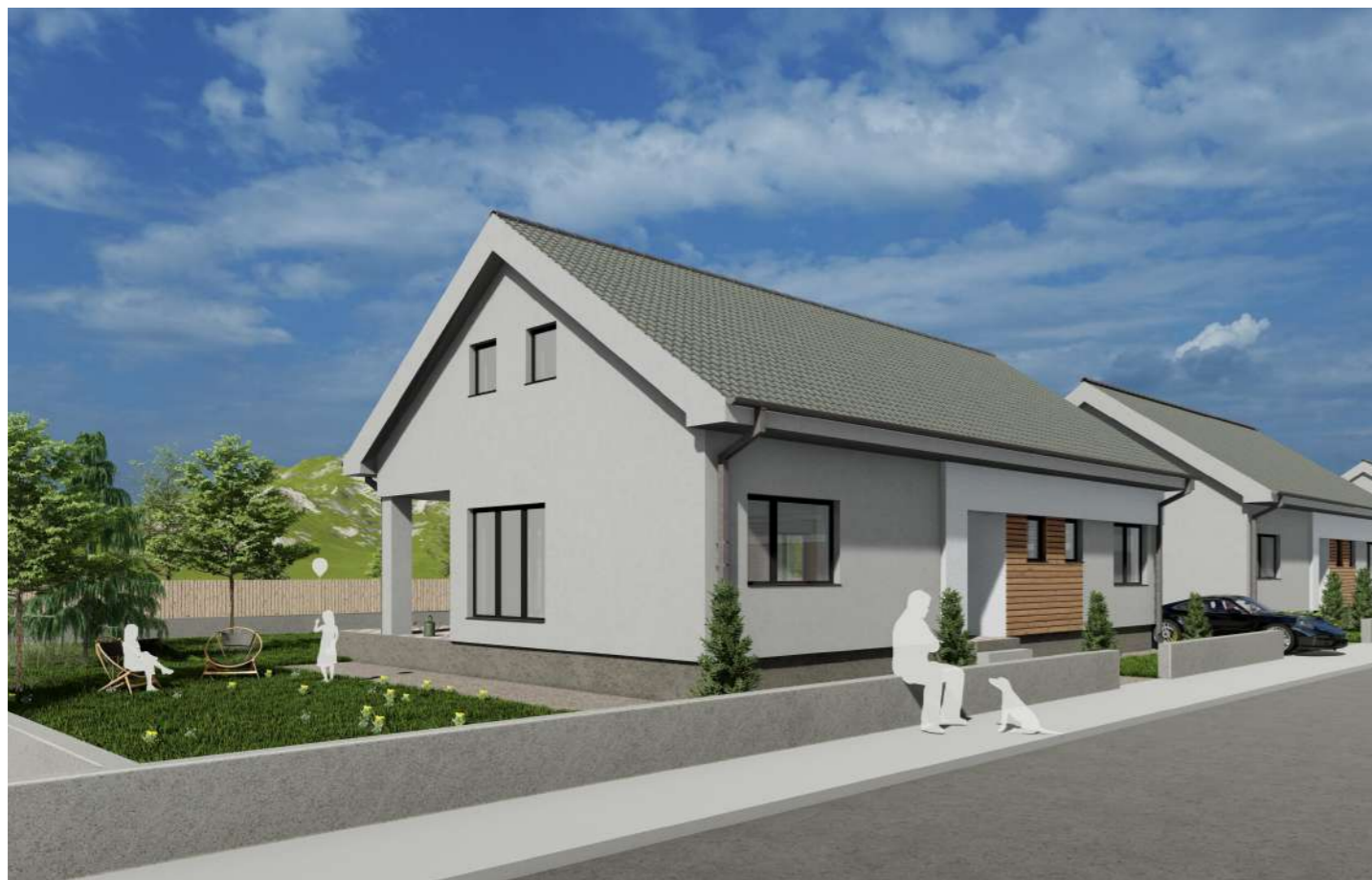
Perspectiva din zona cu locuinte (UTR Lr*)