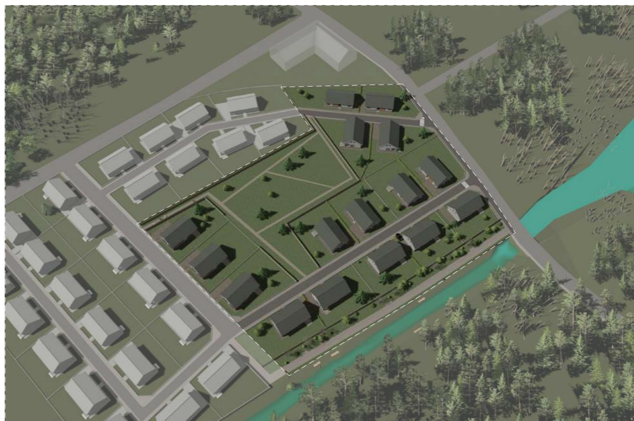
Imagine aeriana cu propunerea