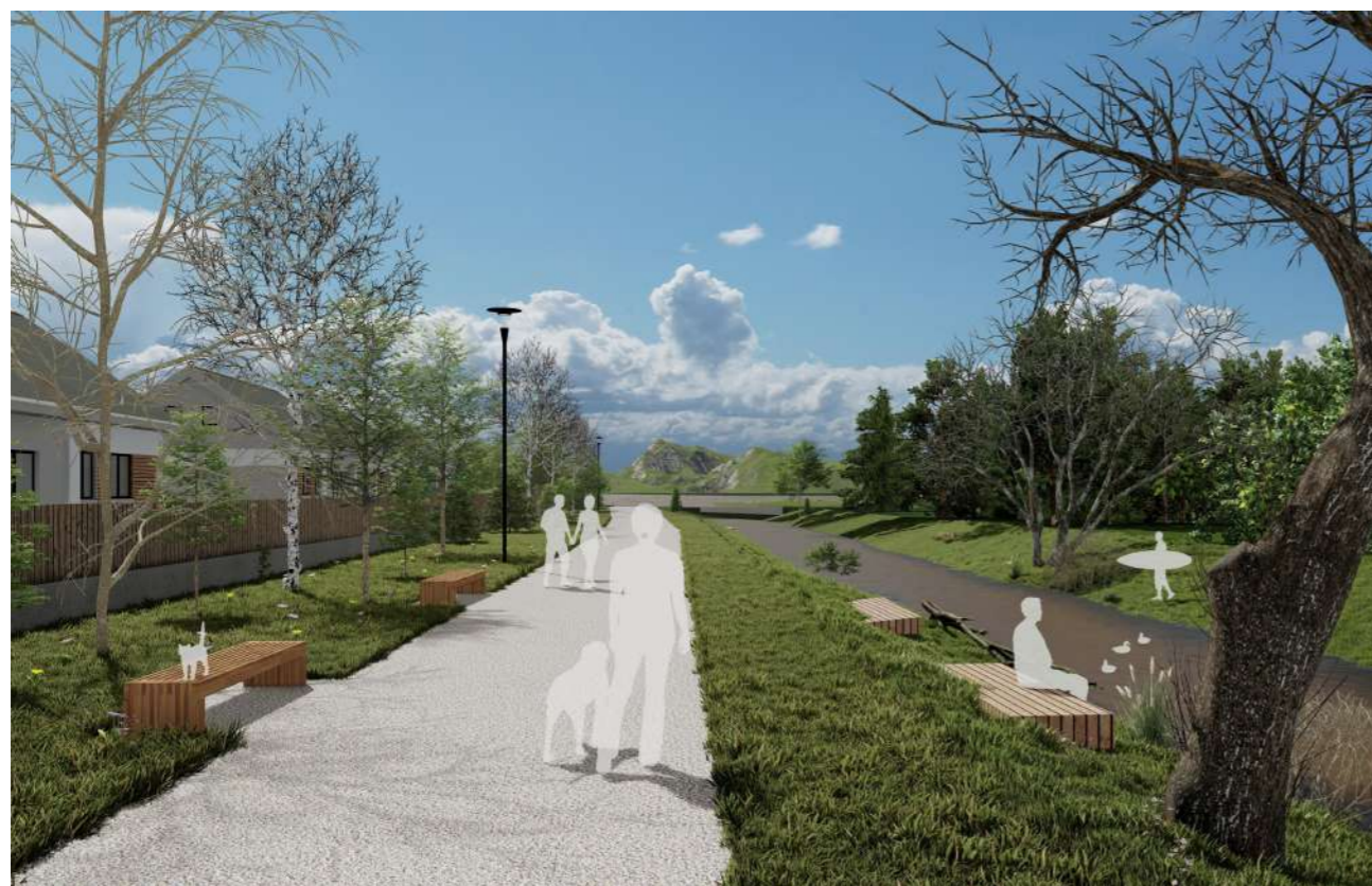
Atmosfera din zona malurilor (UTR Vp*)